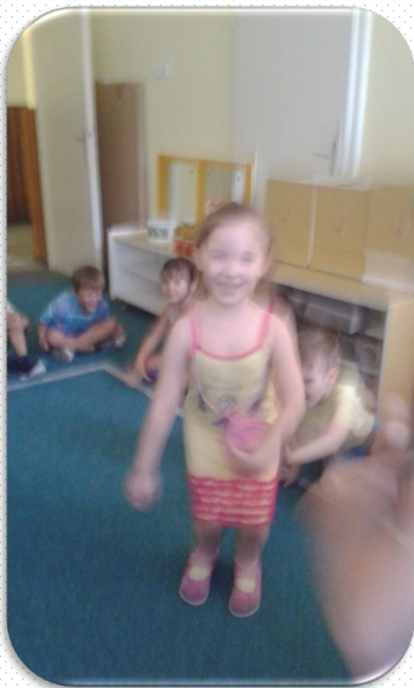
АУРОРА СЕ СЕТИЛА ШТА ДА РАДИ