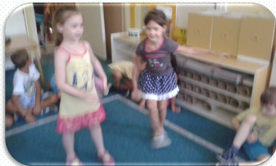
АУРОРА ЈЕ СРЕЛА АРИЈЕЛ