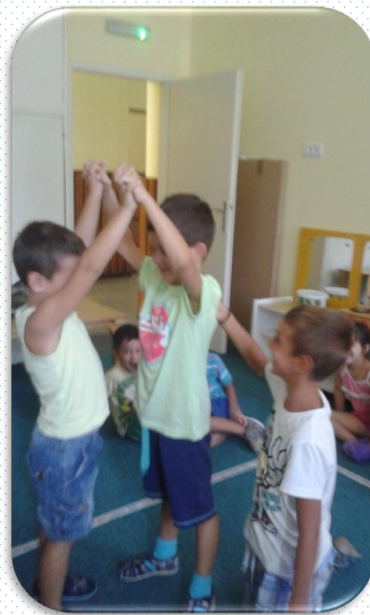
МАЈСТОР JE ПОПРАВИО ДРВО