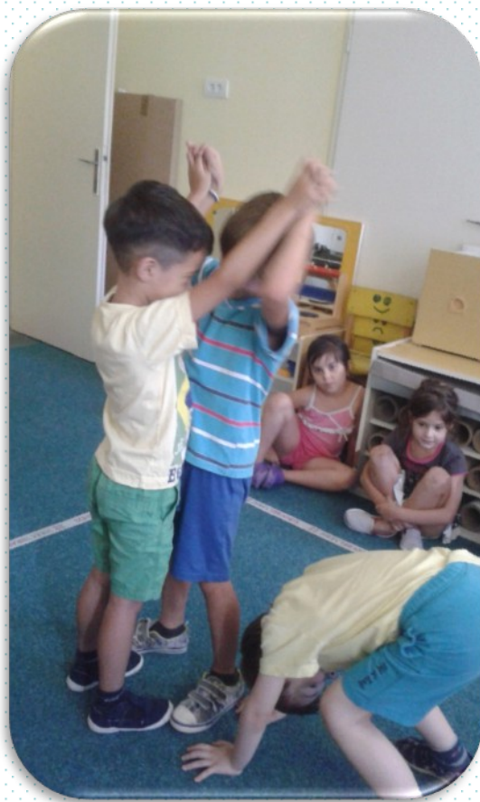
СТАРО ДРВО И JEЖ