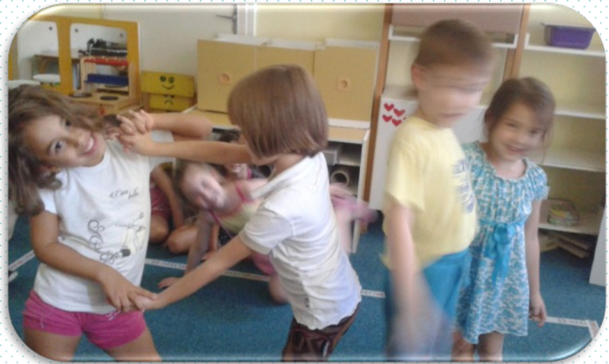
ПРОЗОР И ВРАТА