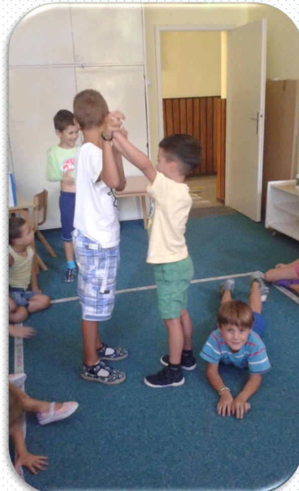
СРЕЋНА ГЛИСТА КОЈА ИМА СТАН